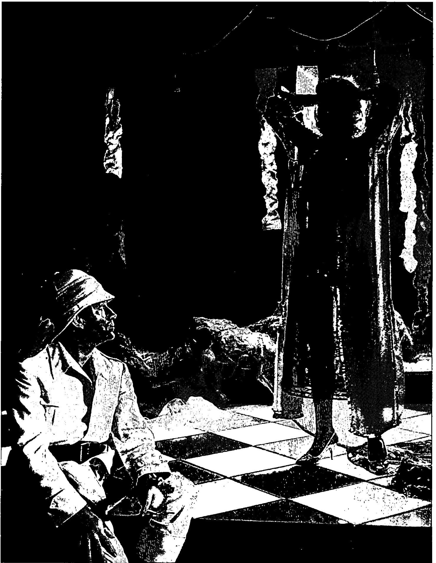
• LA DONNA SCIMMIA • (UGO TOGNAZZI, ANNIE GIRARDOT).